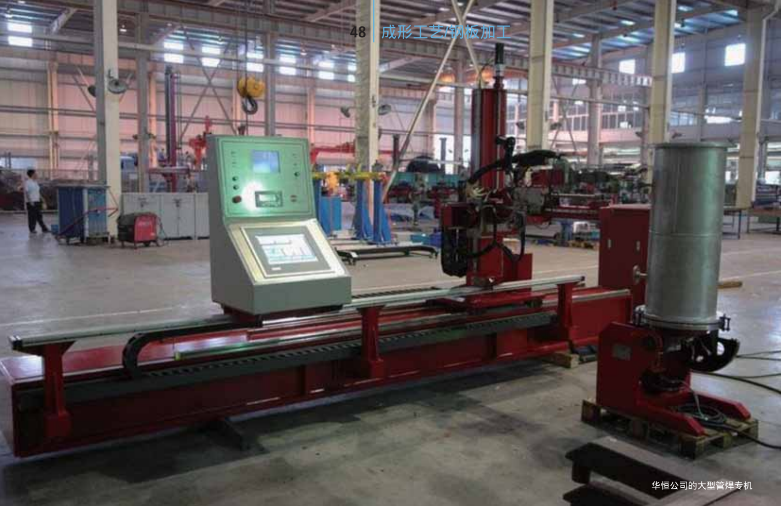
华恒公司的大型管焊专机