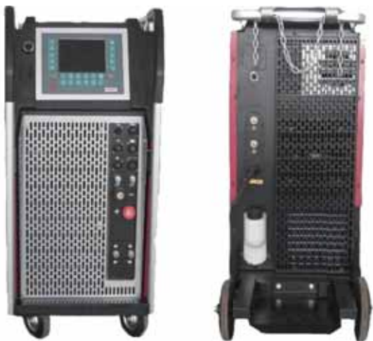
新一代焊接设备锐弧 400