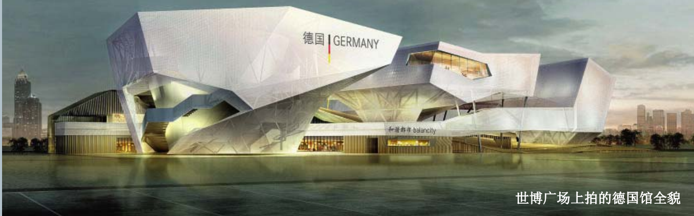
世博广场上拍的德国馆全貌

2009年7月8日，2010上海世博会德国馆举行封顶加冠仪式，作为本次盛会的赞助商，倍福中国应邀参加了此次庆典活动。德国馆建筑面积为6000平方米，打破了历届世博会上德国展馆规模的纪录。德国馆将以“和谐城市”这一主题向大家展示德国未来将如何创造美好城市中的美好生活。未来城市生活强调的是求新与存旧、创新与传统、集体与个人以及全球化与国家认同之间的平衡协调。