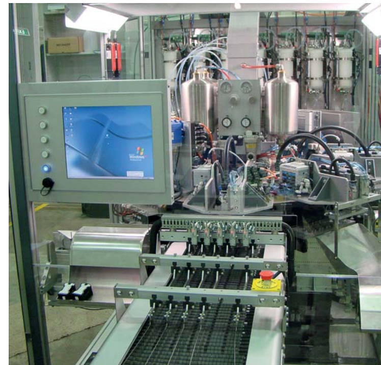
卸料输送带和墨水处理驱动平台

Precision Mechatronics www.premecha.com Beckhoff Australia www.beckhoff.com.au