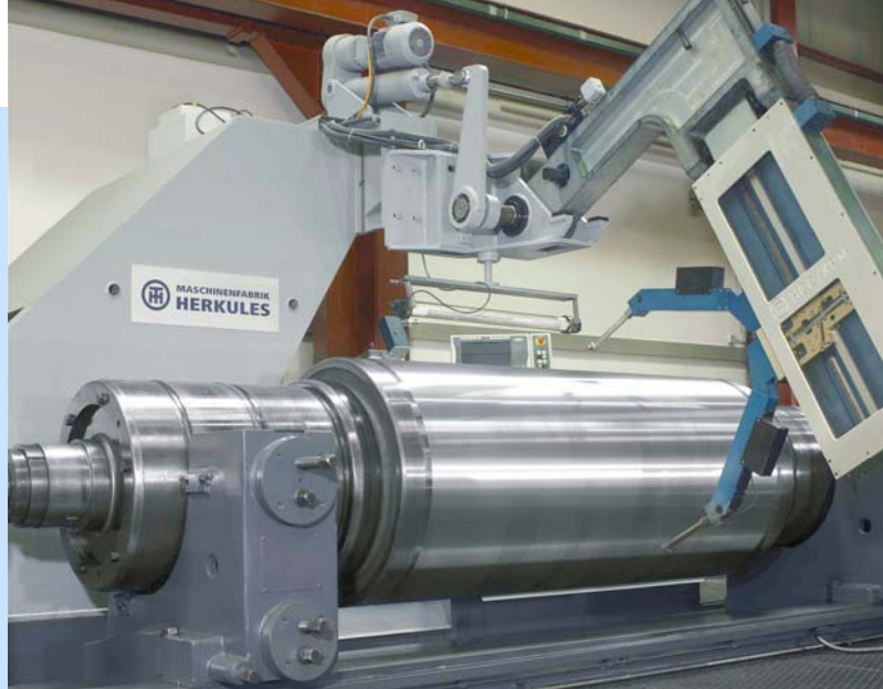
型号为 WS 600 的 Herkules 轧辊磨床。待加工的辊子最重可达 400 吨 ，最长可达 10 m 。

机床输入通过控制面板实现，控制面板是根据 Herkules 的特殊要求与其合作设计而成的。所有的硬件操作元件都集成在面板中，通过 Lightbus 与控制 PC 相连。这种紧凑型、高度集成的外观设计能够实现稳定的机床管理和手机支持的控制站。 HCC 图形用户界面 ( GUI ) 在面板上直观显示，操作人员通过该界面可以调整和操作复杂的机床。操作人员通过 GUI 获取与辊子及当前磨削状态相关的所有信息。 TwinCAT 与多语版 GUI 通过 Beckhoff 多功能通讯接口 ADS-DLL 相连。