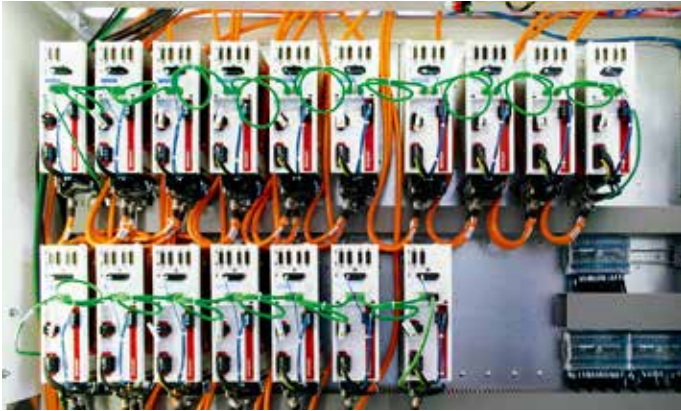
Twins 连续生产线的中央控制柜概览图，煤气设备的小型零部件就是在这个生产线上加工而成的总共使用了 15 个双通道和 2 个单通道 Ax5xxx 系列 EtherCAT 伺服驱动器用于控制这些轴

“在我们刚开发好时，这款自动串联式测试装置最大的创新特点是在两个工作站之间，零部件的拾放是相对独立的。”与 Franco Borsi 一起于 1995 年共同创立 Beocom 公司的 Ivan Omodei 说道。“虽然自动串联装置在当时并不是什么新事物，但以前只有在两个加工操作都完成后才能拾取零部件，因此周期时间也比较长。转向使用基于 PC 控制平台后，我们能够基于时序主站逻辑分别缩短周期和控制时间。”