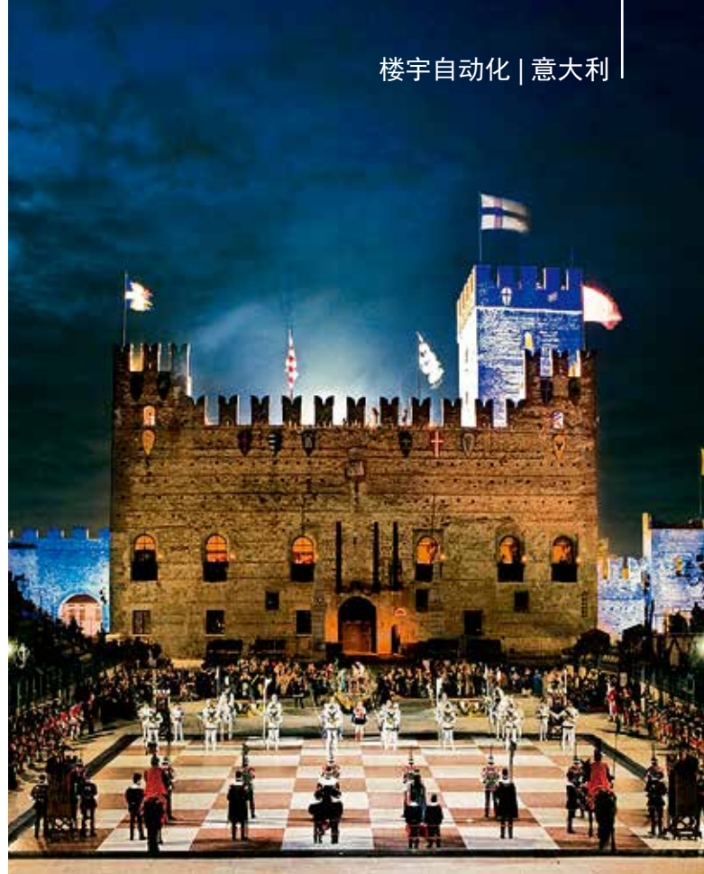
马罗斯蒂卡以真人替代棋子的真人国际象棋比赛闻名，这项活动源自一个古老的传统，每两年于九月中旬在象棋广场举行一次

式实现，因此，镇政府正计划逐步改造更多区域的照明系统。它们可以通过模块化 I/O 系统轻松实现。