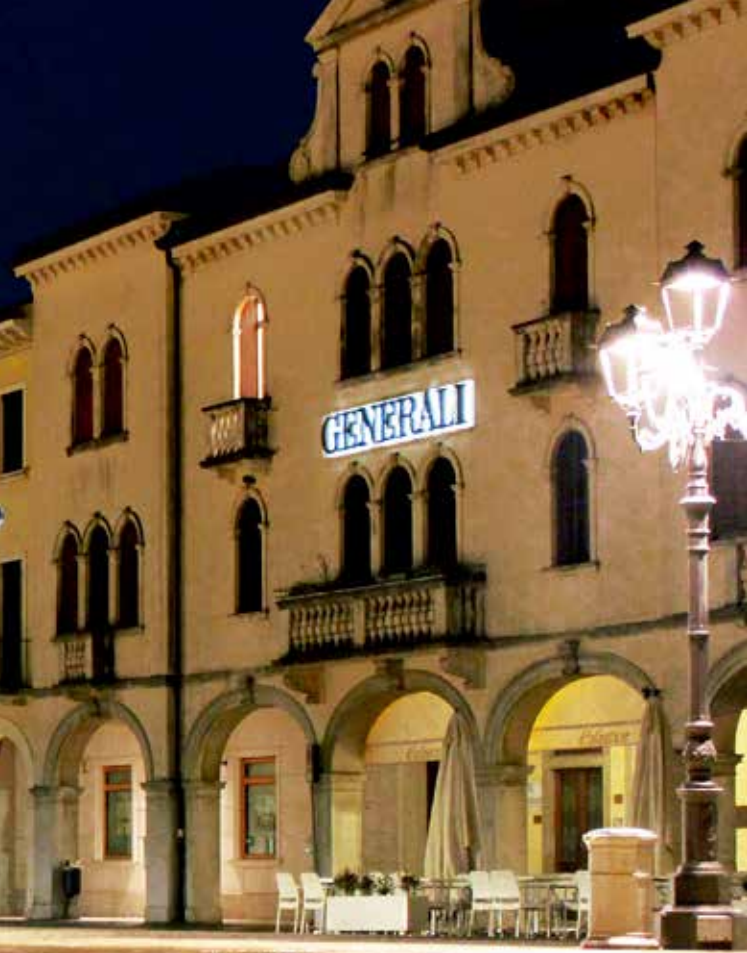
现代化照明控制系统降低了马罗斯蒂卡历史镇中心约 40 % 的夜间环境照明的能源需求