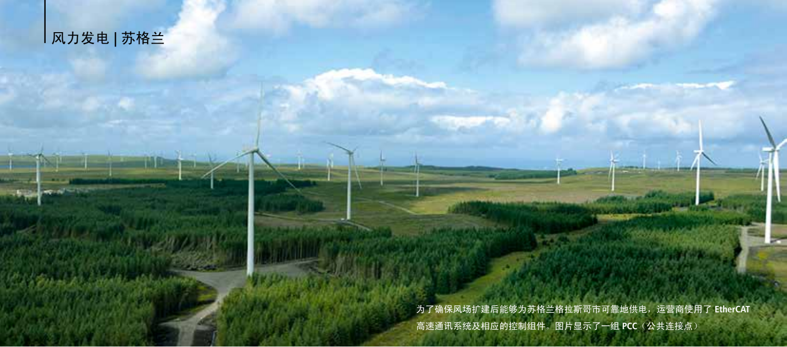
为了确保风场扩建后能够为苏格兰格拉斯哥市可靠地供电，运营商使用了 EtherCAT 高速通讯系统及相应的控制组件。图片显示了一组 PCC（公共连接点）