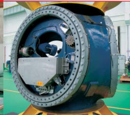
明阳在中国的最南部城市湛江建造了第一个额定功率为 1.5 MW 的风力发电机组

况（如风速和风向）必须得到控制，以便让系统能够满足严格的电气质量要求。相对于其它省份来说，位于华南的湛江风质量较高且稳定，但同时也常年受到台风威胁。在施工期间已经经历过两次台风。风力发电机组必须能够应对 50 m/s（180 km/h）以上的风速及强降雨。南海正好位于北纬 20 度，比中欧地区的气候还要极端。