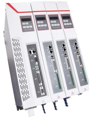
图 4: HSHA 系列伺服驱动器——EtherCAT 从站