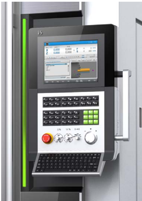
图 3: i5 的数控面板——EtherCAT 主站

除了设备本身功能的实施，在研发初期，沈阳机床上海研究院对总线选择做出了预言和评估。因为 i5 平台要求通过以太网进行云端管理，而基于以太网技术的物理层使得车间信息化的成本变得可以接受，现场设备间的互联变得很简单。因此，将目标锁定了工业以太网的通信技术。