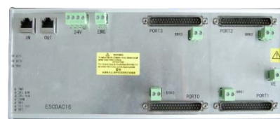
图 5: I/O 设备——EtherCAT 从站