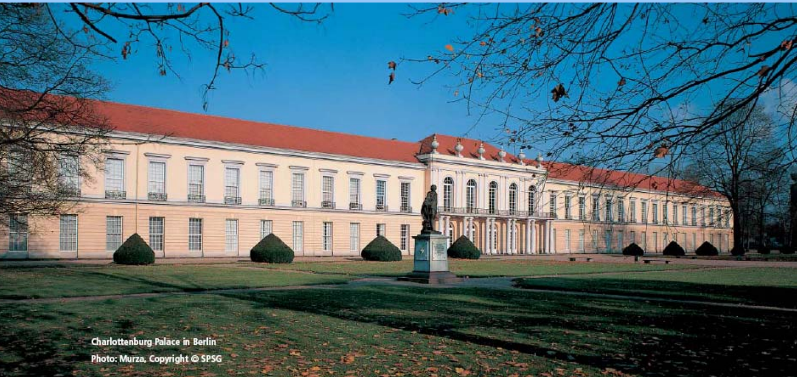
Charlottenburg Palace in Berlin

德国柏林夏洛滕堡宫殿新翼东侧的七个房间于近期翻新改造，成为当今柏林最先进最安全的展馆之一。该工程资金来源于柏林勃兰登堡的普鲁士宫殿园林基金会，总耗资达 160 万欧元。IMAS Falkenberg 仪器仪表公司与 Hermsdorf 控制工程公司联手协作，承接了本次工程的楼控系统部分。该系统高效复杂，用于控制室内空调、灯光以及安防设施。其核心部分采用了 Beckhoff 公司的以太网组件、工业 PC 和控制面板。