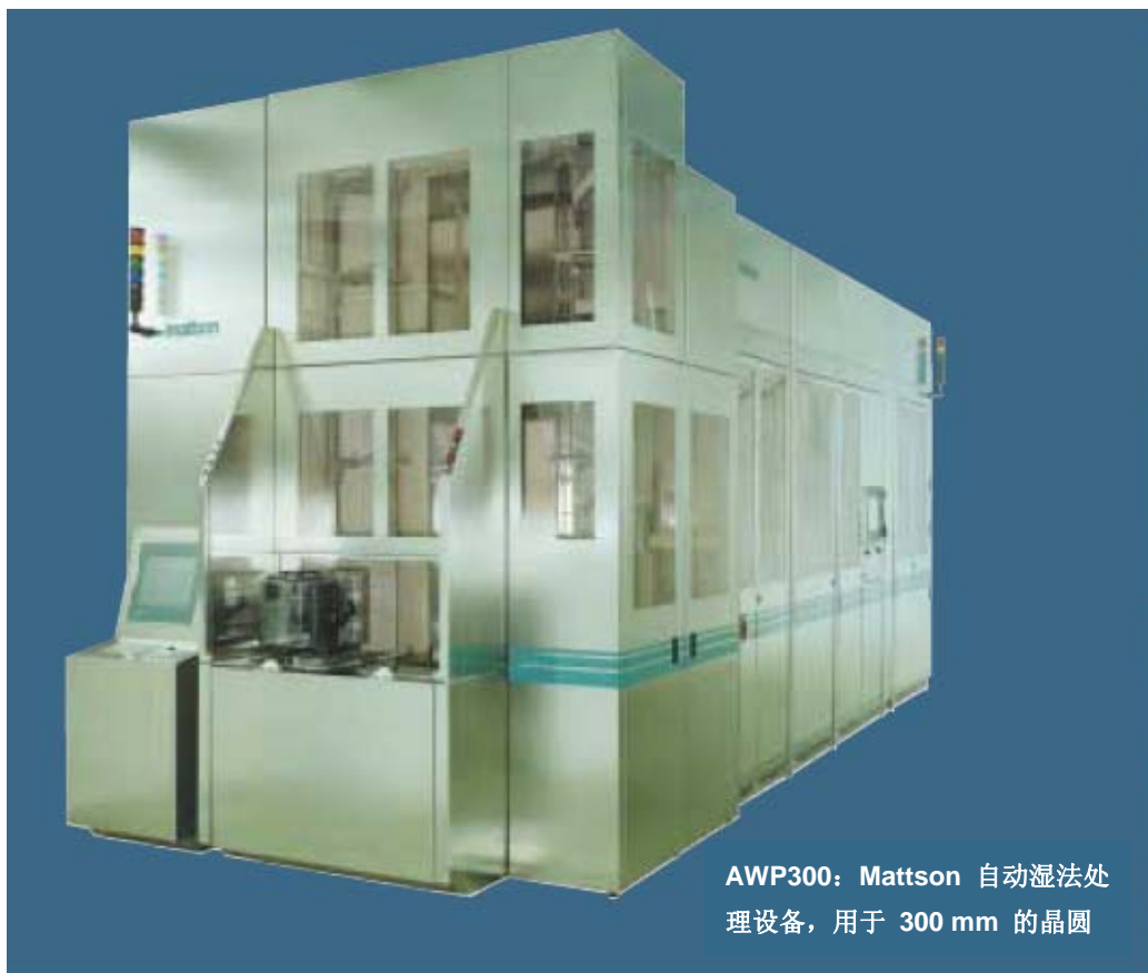
AWP300: Mattson 自动湿法处理设备, 用于 300 mm 的晶圆