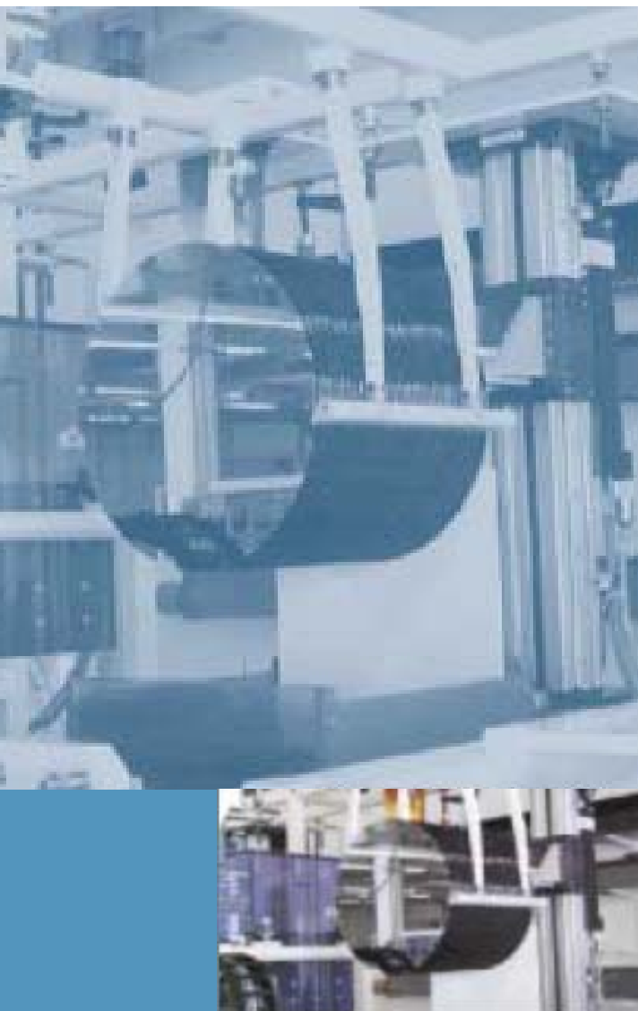
正在处理中的 300 mm 晶圆